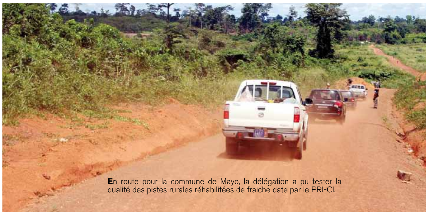
En route pour la commune de Mayo, la délégation a pu tester la qualité des pistes rurales réhabilitées de fraîche date par le PRI-CI.