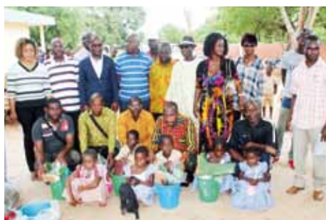
Alors qu'ils croyaient avoir tout reçu du Prici, les enseignants et parents d'élèves de la commune de Mayo ont été agréablement surpris de voir le Coordonnateur du Prici arriver les bras chargés de matériels d'entretien.