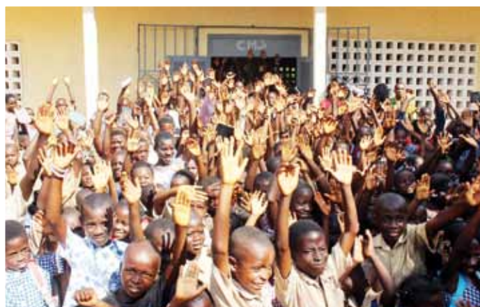
A Mayo, la délégation du Pri-ci a été accueillie à l'EPP Madou Sahoua par des élèves, parents d'élèves et enseignants émerveillés par les travaux de réhabilitation exécutés dans leur établissement.