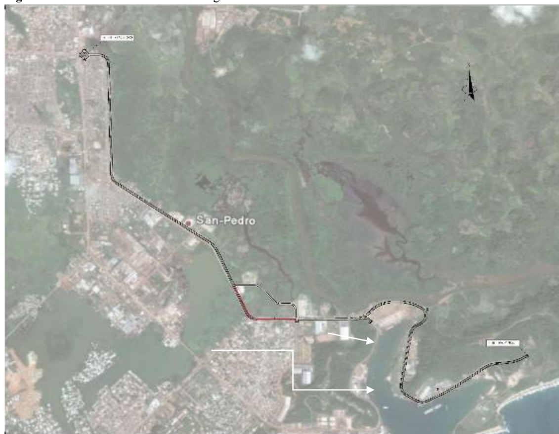
Figure 3 : Localisation de la route des grumiers

Sur le premier tronçon, la voie est bordée par le quartier Seweké à l'Ouest, zone d'habitat économique et par une zone inondable à l'Est où sont installés des ateliers mécaniques, des ferrailleurs, des charbonniers, etc., puis par la zone industrielle.