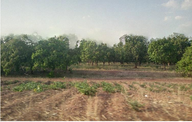
Photo 5 : Vue de l'emprise de la canalisation dans la zone de Ferkessédougou