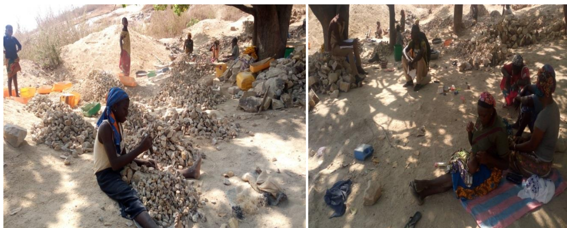
Photo 1: Vues des activités identifiées dans l'emprise du château 3000m 3

Le site dédié pour la réalisation du nouveau château 3000 m 3 est situé dans le quartier Cocody. Il se trouve au flanc d'une colline où se réalise des activités de concassage et de commercialisation de granites par des femmes. Ces femmes seront contraintes d'abandonner cette activité du fait des travaux de construction du château d'eau.