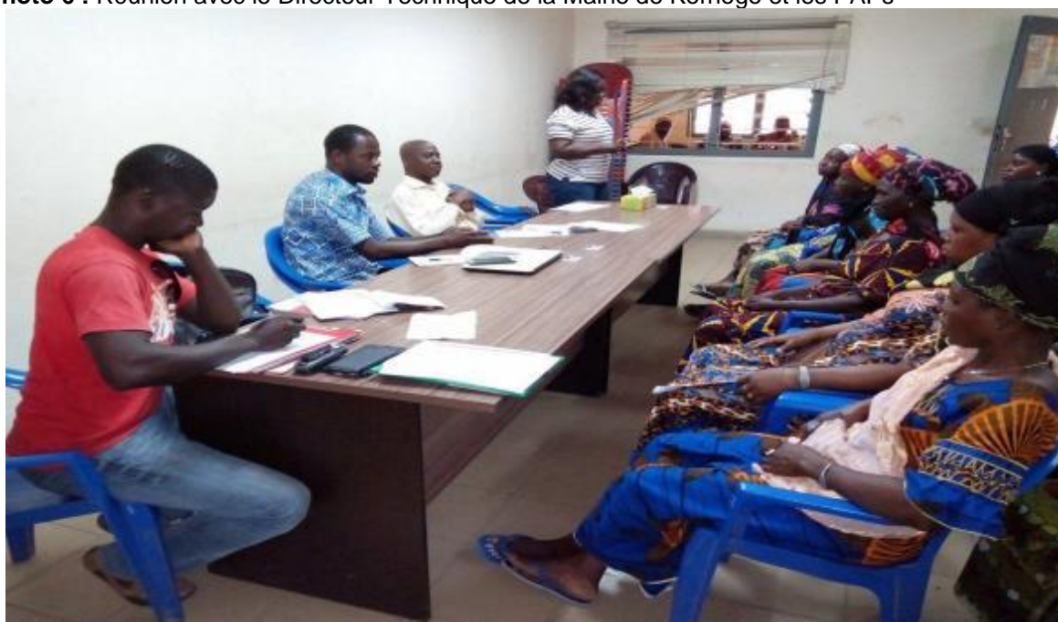
Photo 6 : Réunion avec le Directeur Technique de la Mairie de Korhogo et les PAPs

Au titre de l'information et de la consultation communautaire, plusieurs rencontres ont été initiées par le consultant dans le cadre du présent PAR, notamment avec les autorités administratives d'une part et avec les représentants des corps constitués et les populations affectées d'autre part.