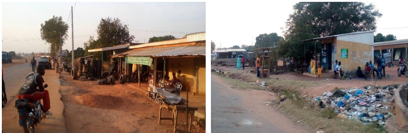
Photo 3: Vues du groupe scolaire SODEC et du maquis situées dans l'emprise de la canalisation